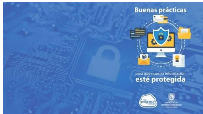
Imagen que se utiliza en el fondo de una interfaz gráfica del escritorio de los equipos de cómputo. Se despliega por medio del directorio activo, para que los colaboradores de la Administración Municipal estén conectados con las buenas prácticas de Seguridad de la Información.