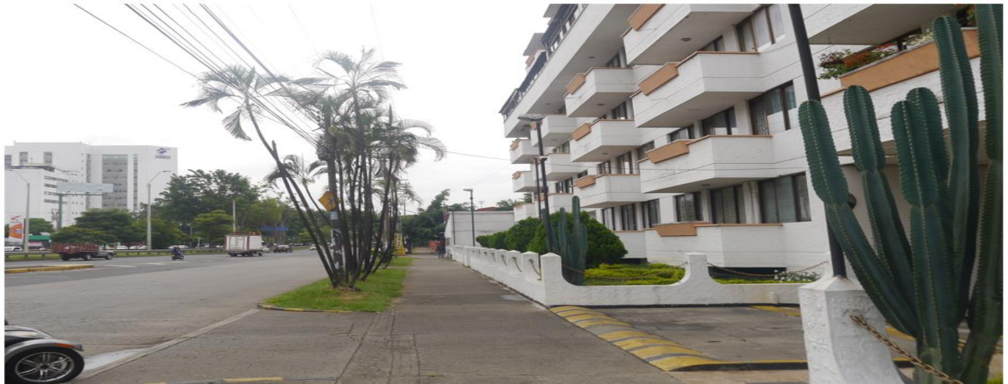
Foto tomada del lado de Manzana contiguo al predio visitado.

ALCALDÍA DE SANTIAGO DE CALI DEPARTAMENTO ADMINISTRATIVO DE PLANEACIÓN