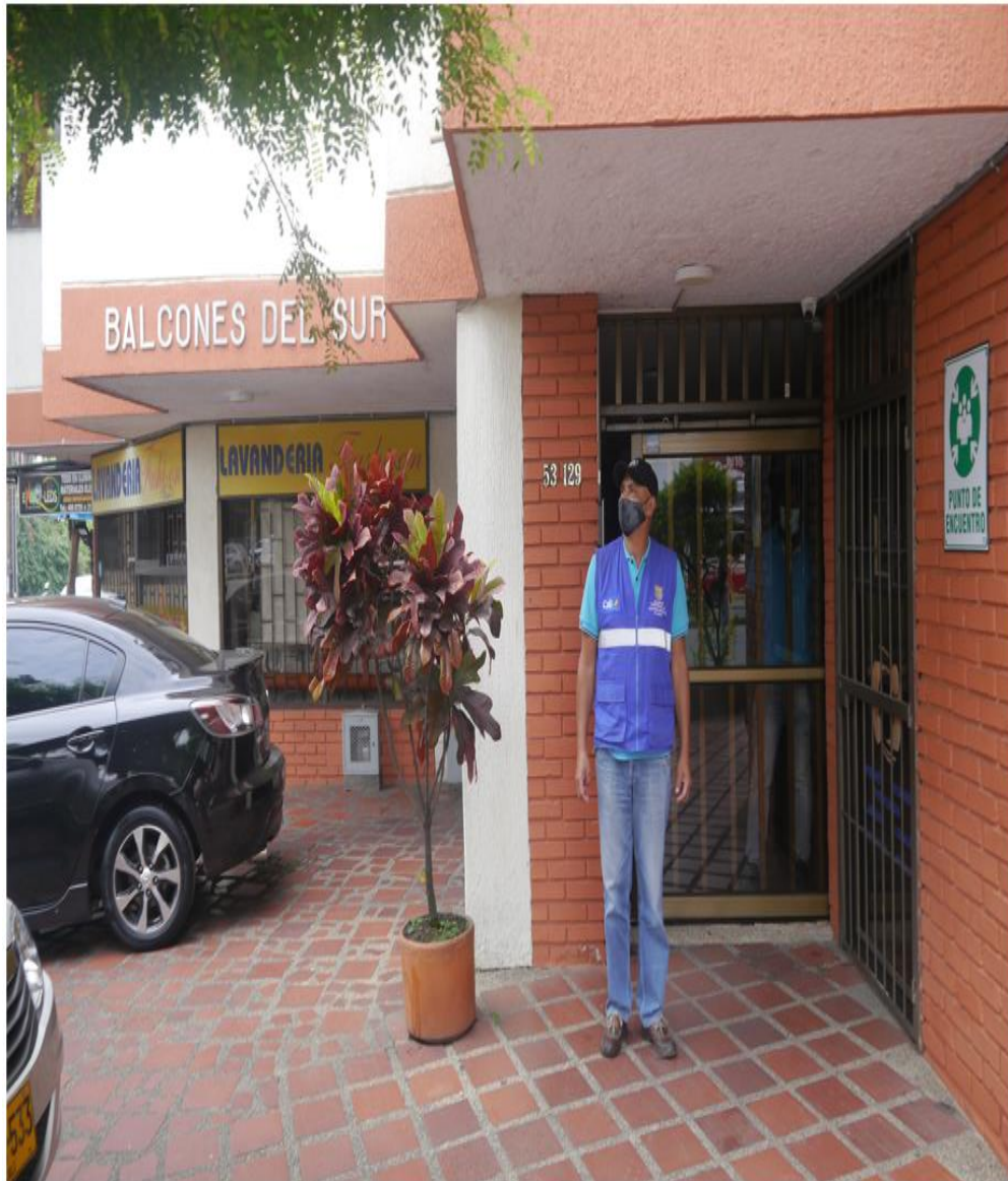
Foto del antejardín

ALCALDÍA DE SANTIAGO DE CALI DEPARTAMENTO ADMINISTRATIVO DE PLANEACIÓN