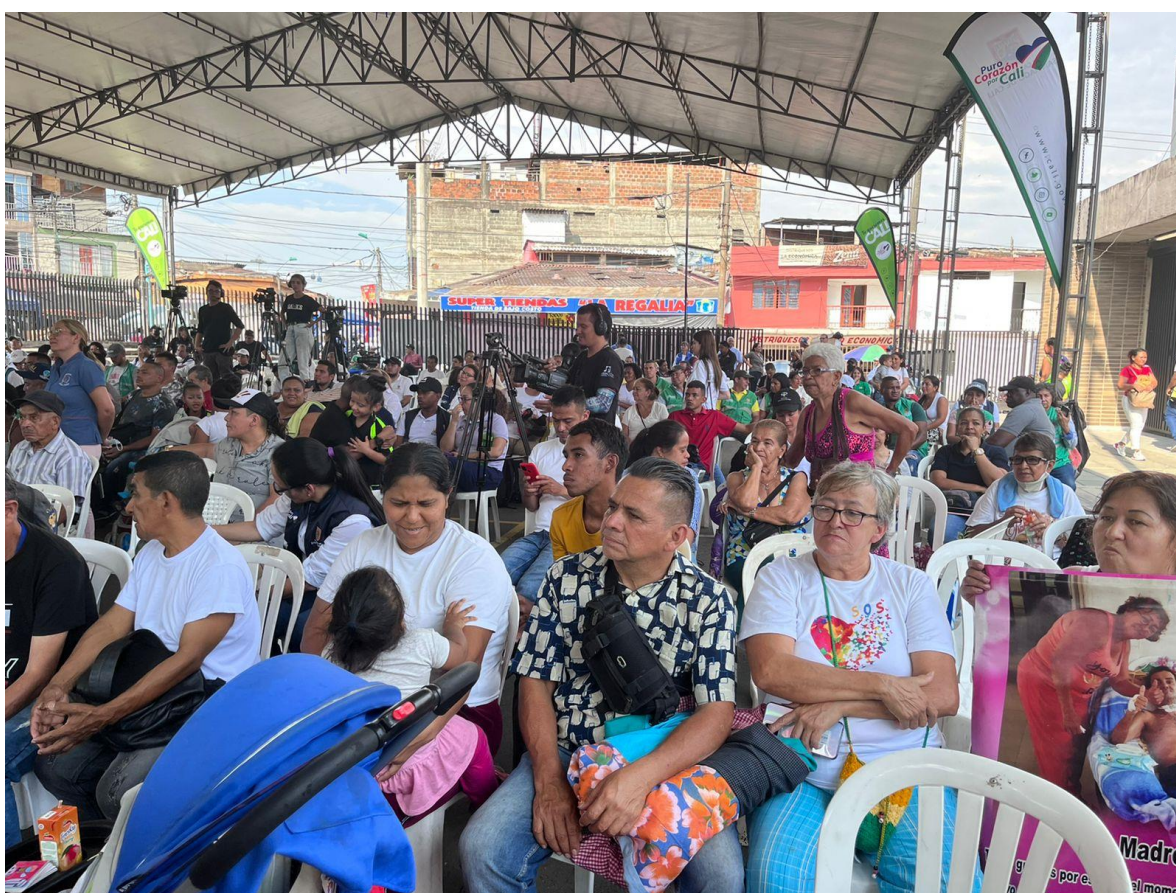
COMUNA 10 – GOBIERNO AL BARRIO GUABAL – 15.09.2022