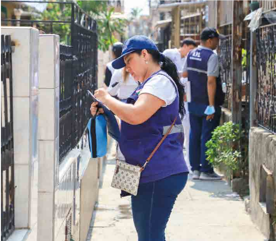
Las visitas se realizan en los barrios con mayor incidencia del dengue.

Mediante tomas barriales, actividades de promoción de la salud y prevención de la enfermedad se realizan acciones informativas y