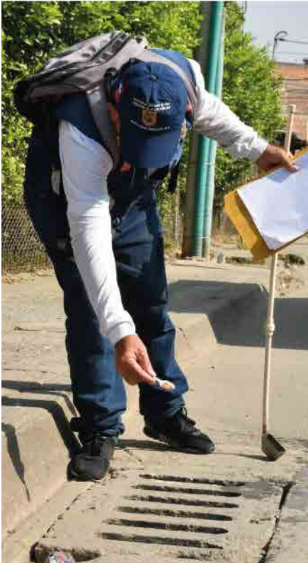
Control a sumideros por parte de la Secretaría de Salud Pública.

Lavar cada ocho días los tanques y albercas donde almacene agua.