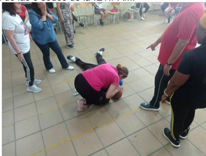
Fig. 4: Taller sensibilización con maestros.