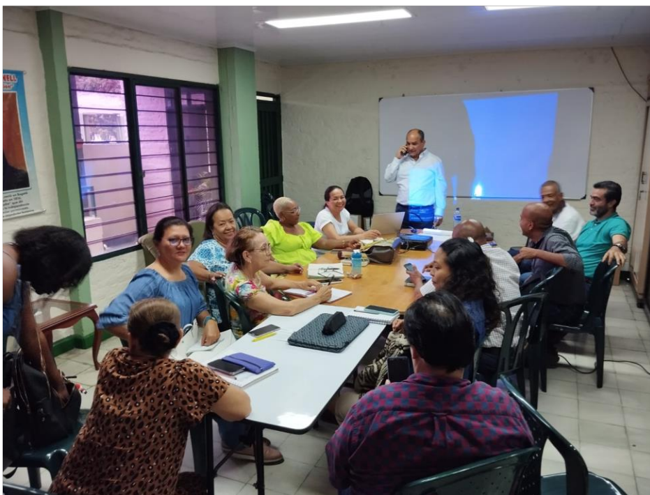
Fig. 5: Espacios para promover la mediación escolar