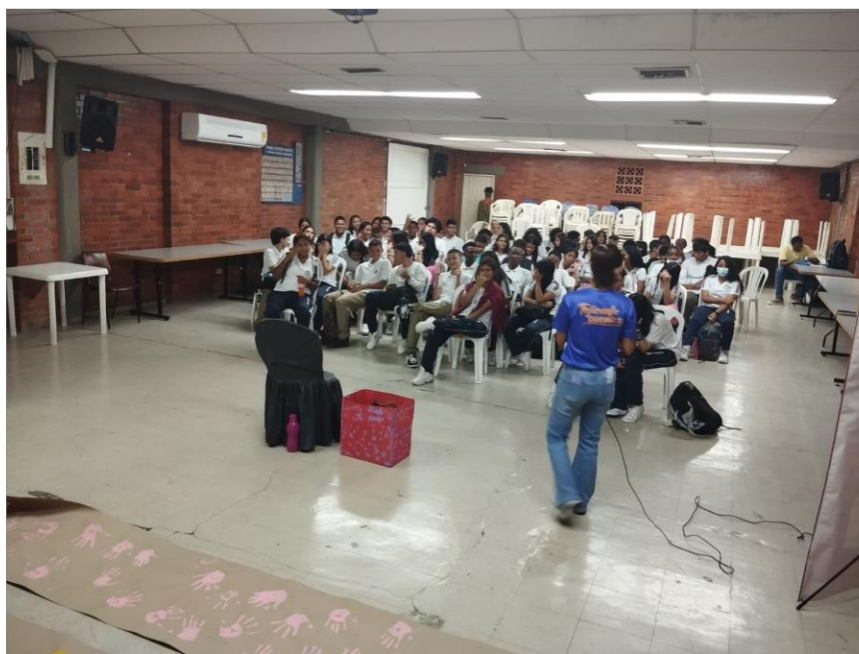
Fig. 2: tejiendo sueños

Fecha: 24/Jul/2023 TRD: 4143.049.22.2-16.01 -2023