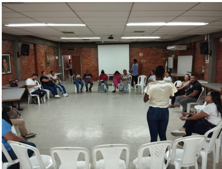
Fig. 1: participación padres en proceso de convivencia escolar

Fecha: 24/Jul/2023 TRD: 4143.049.22.2-16.01 -2023