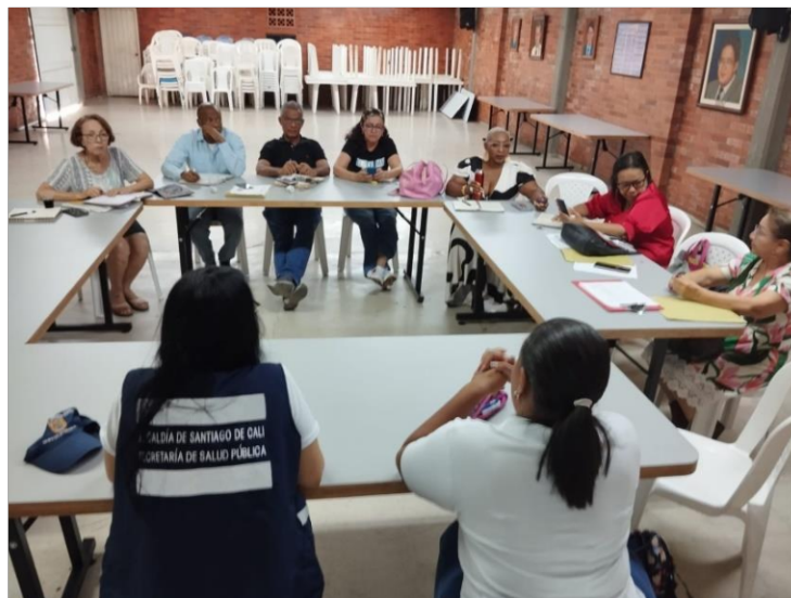
Fig 4. Acompañamiento de la SSPM

Fecha: 24/Jul/2023 TRD: 4143.049.22.2-16.01 -2023