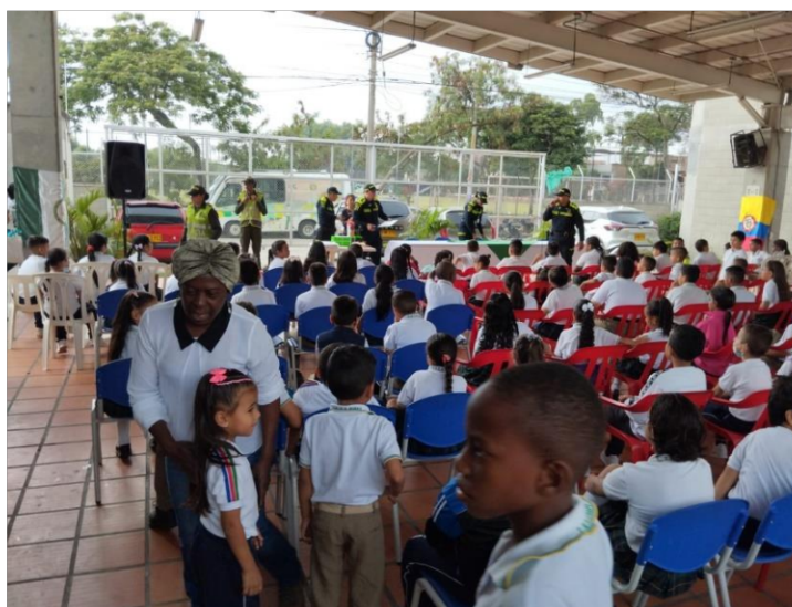
Fig. 3: Sensibilización prevención uso de SPA