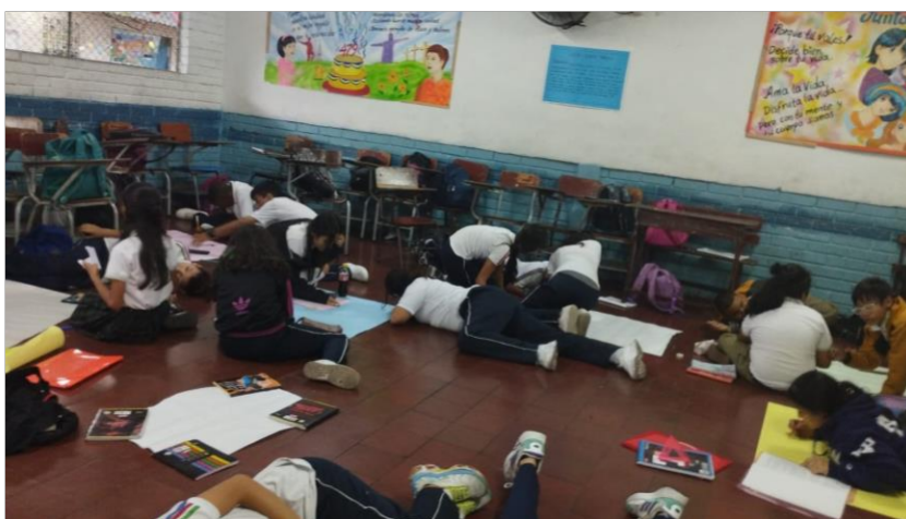
Fig.0: Prácticas pedagógicas no convencionales

un poco las situaciones potenciales de conflicto que se presentan en el diario vivir de la escuela. En cuanto a los espacios de danza y otros grupos de orden cultural la participación ha estado un poco limitada un poco a causa de los horarios en los que se dan las prácticas. Ha sido un poco complejo lograr motivar de una manera más consistente a los estudiantes para que puedan participar abiertamente de ellos dado que esas actividades podrían propiciar estados de desarrollo socio-cultural que fortalece el desarrollo de sus competencias en el campo de la construcción de ciudadanía (fig. 0).