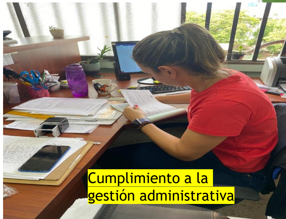
Cumplimiento a la gestión administrativa