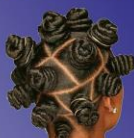
Monte - Bantú- Knot

Se tejían mapas de fuga y plasmaban características de los terrenos.