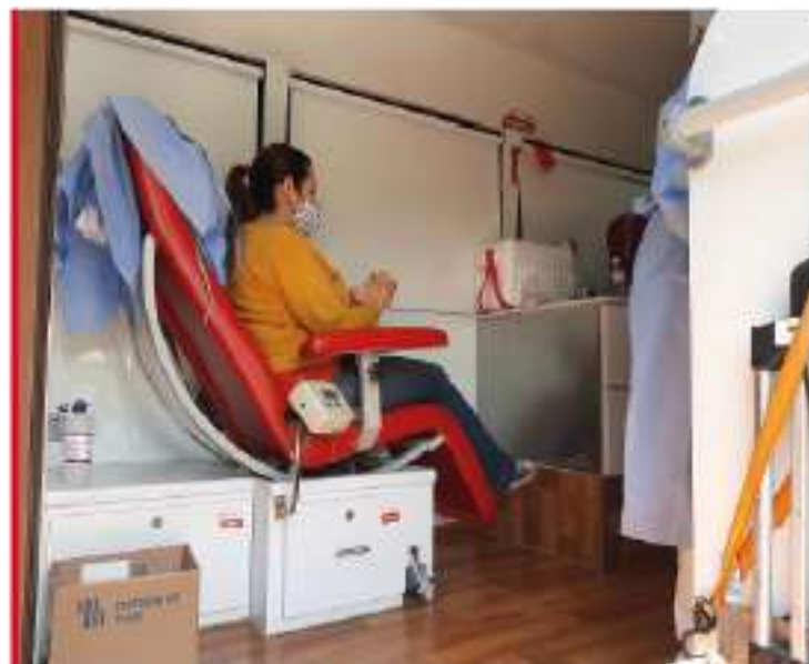
Jornada de donatón de sangre con Cruz Roja Valle.