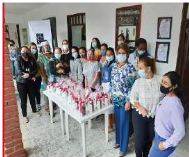
Conmemoración del Día Internacional de la Mujer