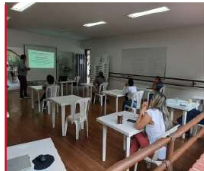
21 Capacitaciones en el marco del fortalecimiento