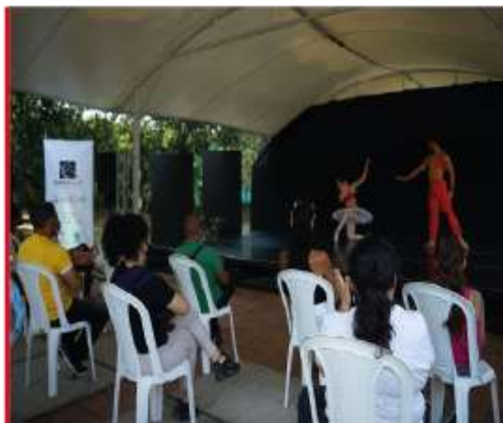
Celebración día del servidor público y desarrollo de jornada Socialización del Código de Integridad.