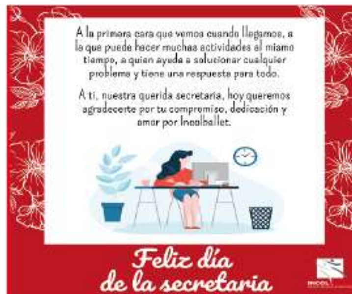
Conmemoración del día de la secretaria.