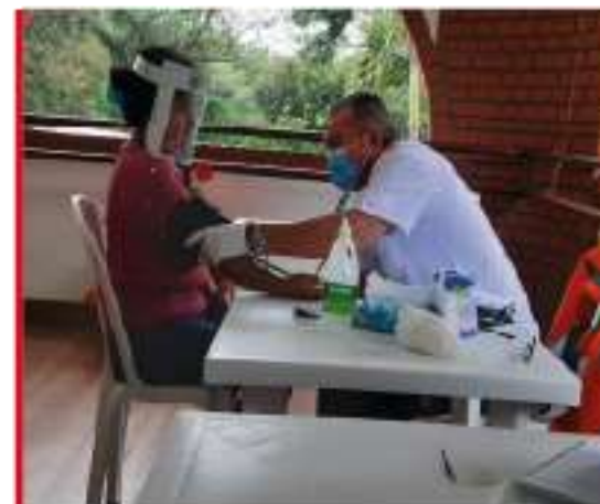
Dos (2) jornadas de salud en apoyo con EMI “Cuida tu corazón” y “Nívelate”.