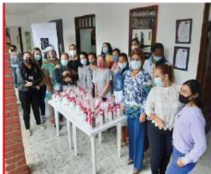
Conmemoración del Día Internacional de la Mujer