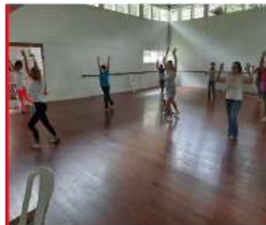
Fomento de la actividad física – Clase de baile y Aero rumba.