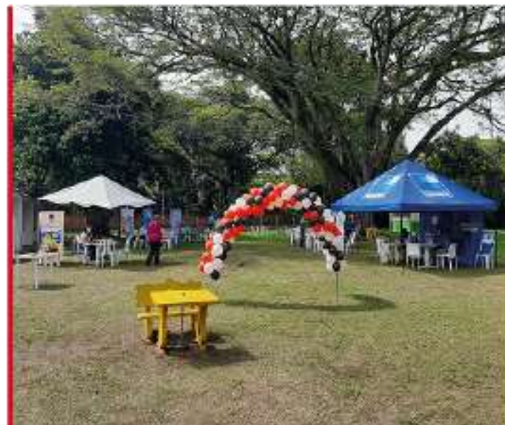
Feria vivienda como parte del Programa de Bienestar.