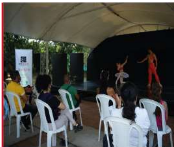
Celebración día del servidor público y desarrollo de jornada Socialización del Código de Integridad.