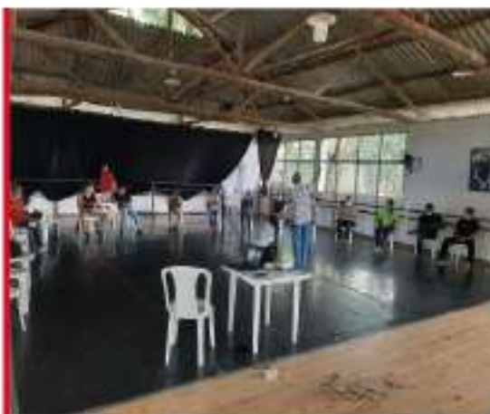
Intervención del riesgo Psicosocial en funcionarios y contratistas con ARL Colmena.