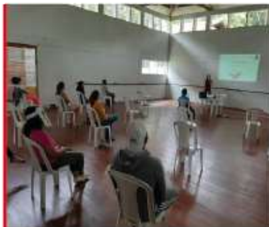
Actividades de fortalecimiento en Código de Integridad –Comunicación Asertiva.