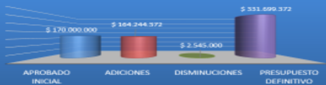
Grafica de Adiciones y disminuciones al presupuesto 2021