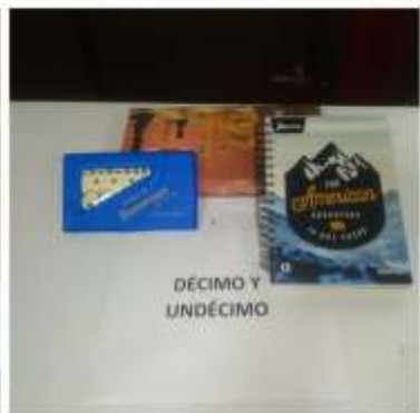
DÉCIMO Y UNDÉCIMO