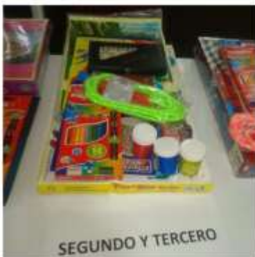
SEGUNDO Y TERCERO