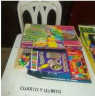
CUARTO Y QUINTO