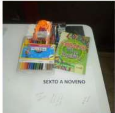
SEXTO A NOVENO