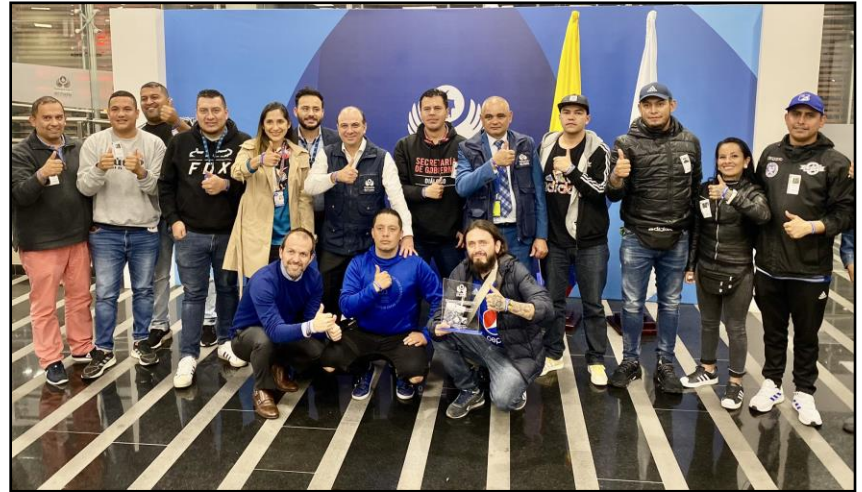
La Previa con el Defensor