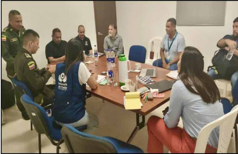
Diálogo con las Comisiones Locales de Seguridad, Comodidad y Convivencia en el Fútbol.