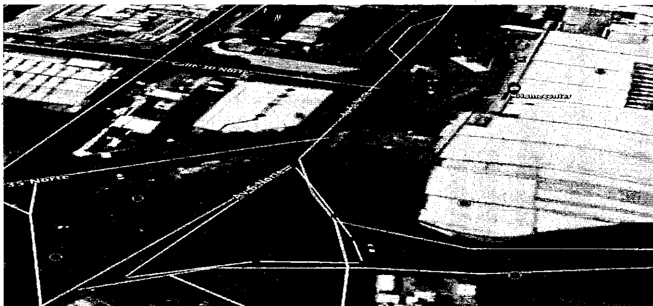
Espacio Zona Verde Separador Vial de la Av.6ª con Calle 35 Norte, Proyecto, área aprox 1874 m 2