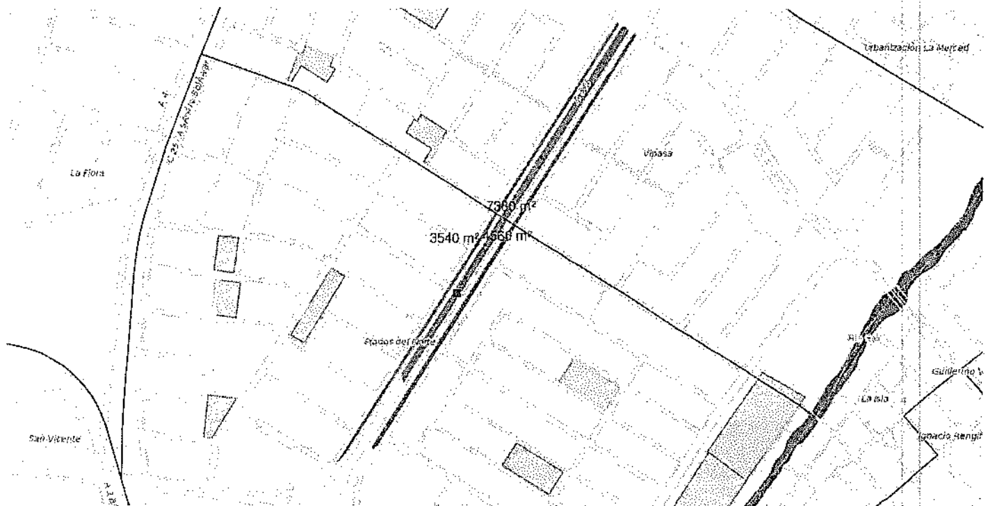
Proyecto Zona Verde Separador Vial Av 3N entre calle 44 N y calle 35 N, barrio Prados del Norte, área aprox 15.460 m2

Así mismo realizar el mantenimiento integral de los jardines existentes y/o plantados por el ADOPTANTE (consistente en platio 2 , abono y fertilización) durante el tiempo de duración del convenio. D) Instalar una valla mínimo por cada 3 mil metros cuadrados, de acuerdo al artículo 50 del Acuerdo 179 de 2006 que a la letra dice: "Avisos en el espacio público como contraprestación a su mantenimiento. El Departamento Administrativo de Planeación Municipal, Subdirección de Ordenamiento Urbanístico, podrá autorizar la instalación de avisos en el espacio público como contraprestación por su mantenimiento, previa elaboración del convenio respectivo entre el particular y la dependencia municipal competente. El tamaño máximo del aviso será de 0.70 (cero punto setenta) por 0.50 (cero punto cincuenta) metros, el cual debe tener un mensaje cívico y un mensaje comercial. Para las zonas verdes se permitirá un aviso por cada 1000 (mil) metros cuadrados". Una vez terminado el Convenio de Adopción se debe retirar la valla instalada en caso de no renovación, y restaurar a su estado natural el espacio usado para el mismo. E) Presentar un Plan de Trabajo anual con las actividades convenidas, en un máximo de treinta (30) días