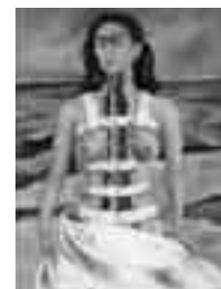
(La columna rota, 1944)

"Cuando su estado de salud empeoró y se vio obligada a llevar corsé de acero, Frida Kahlo pintó este autorretrato en 1944. Una columna jónica con diversas fracturas simboliza su columna vertebral herida. La rasgadura de su cuerpo y los surcos del yermo paisaje agrietado, se convierten en metáfora del dolor y soledad de la artista".