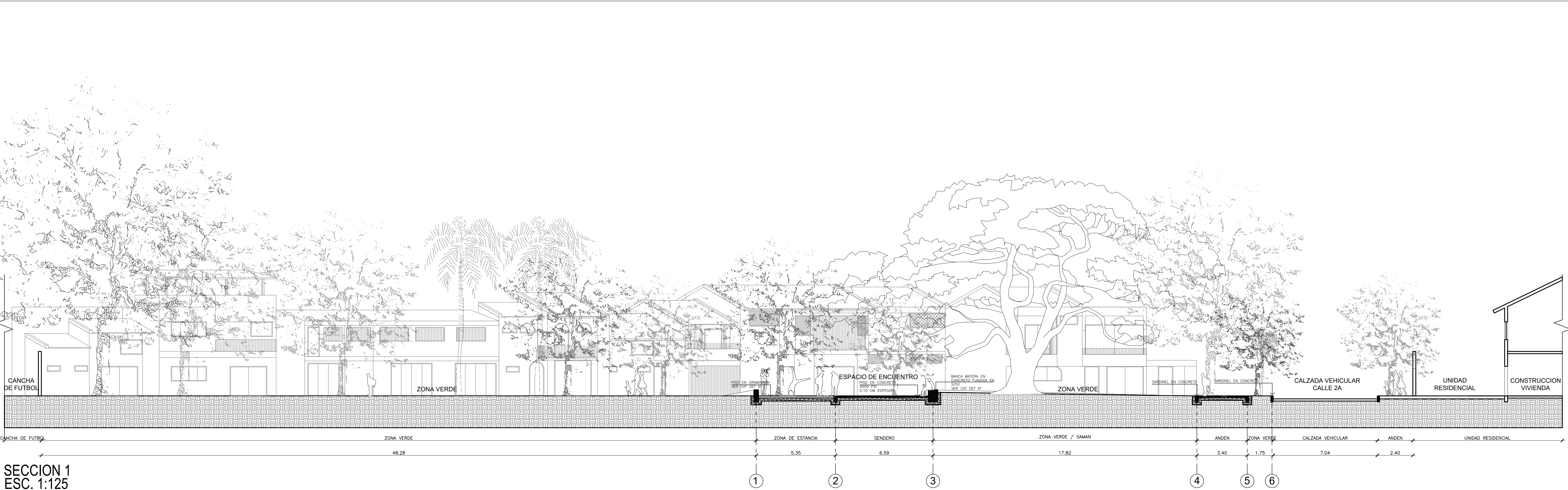
SECCION 1 ESC. 1:125