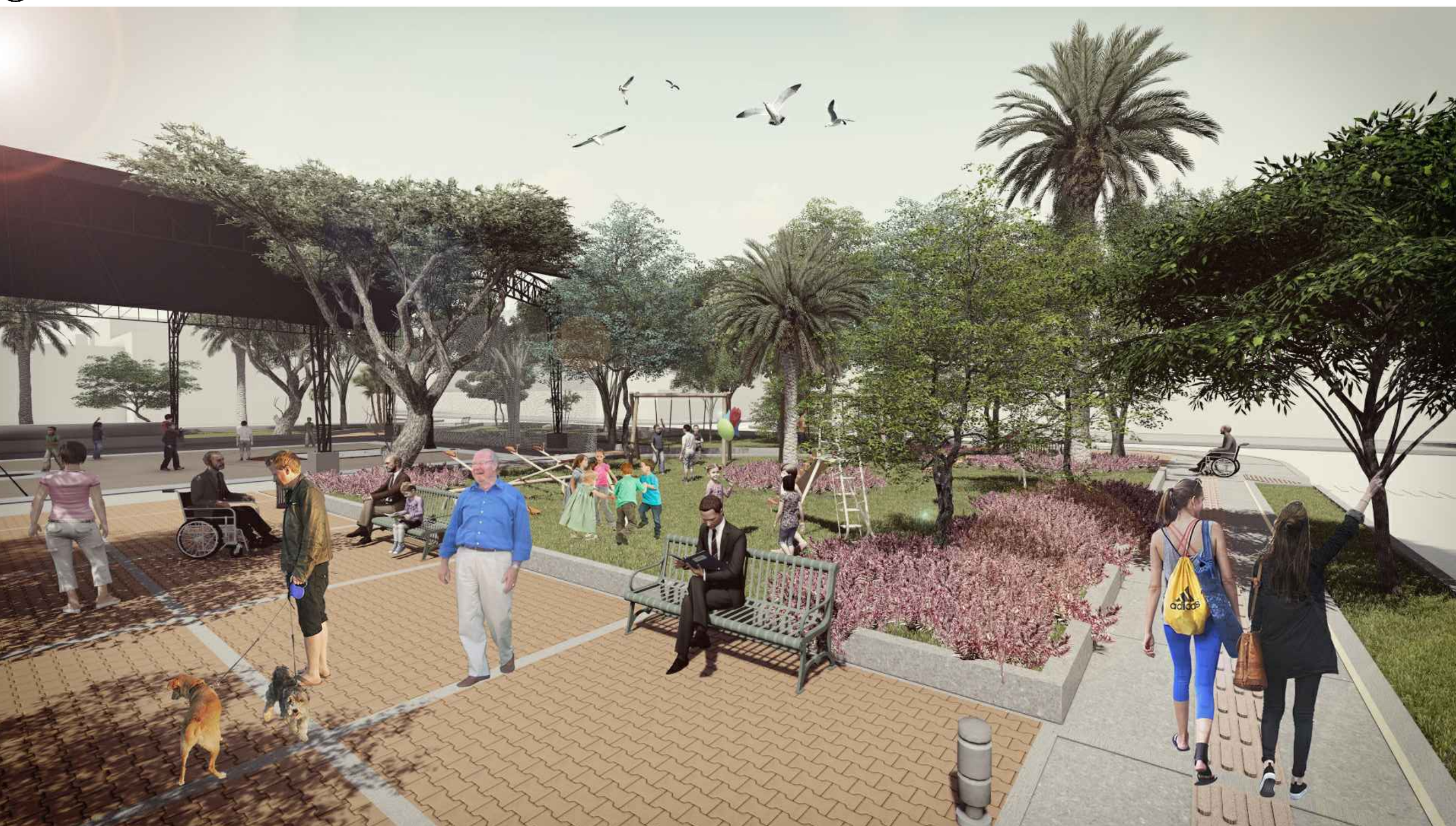
05 IMAGEN JUEGOS INFANTILES