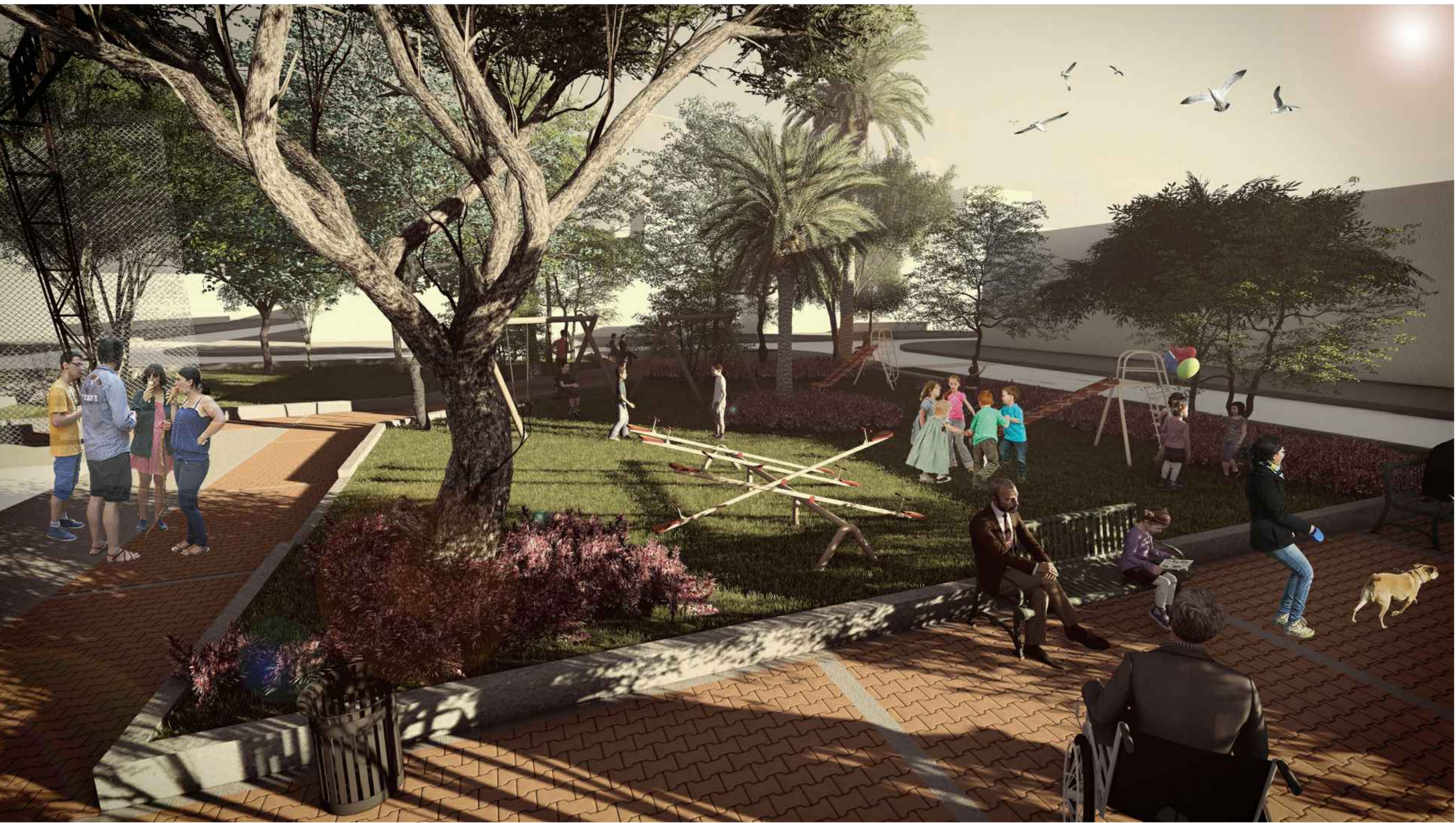
06 IMAGEN JUEGOS INFANTILES