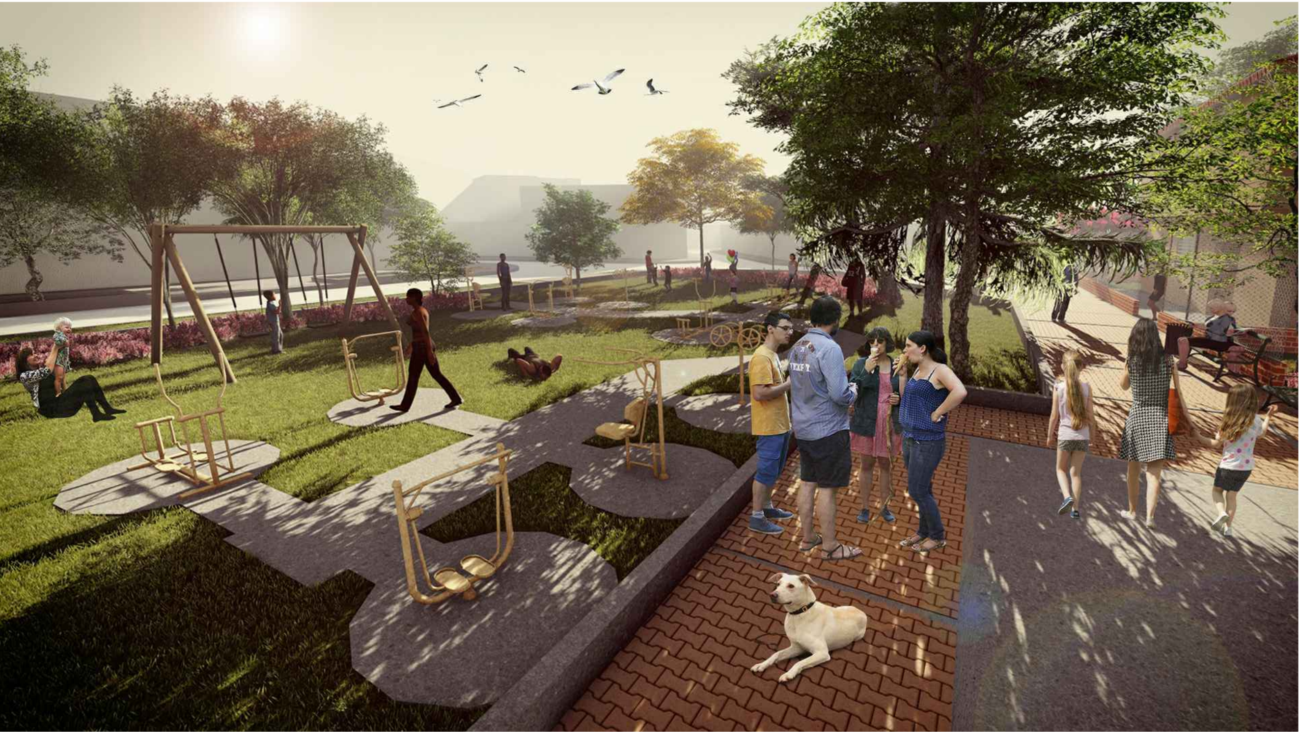
04 IMAGEN BIOSALUDABLES-RECUPERACIÓN PAISAJISTICA