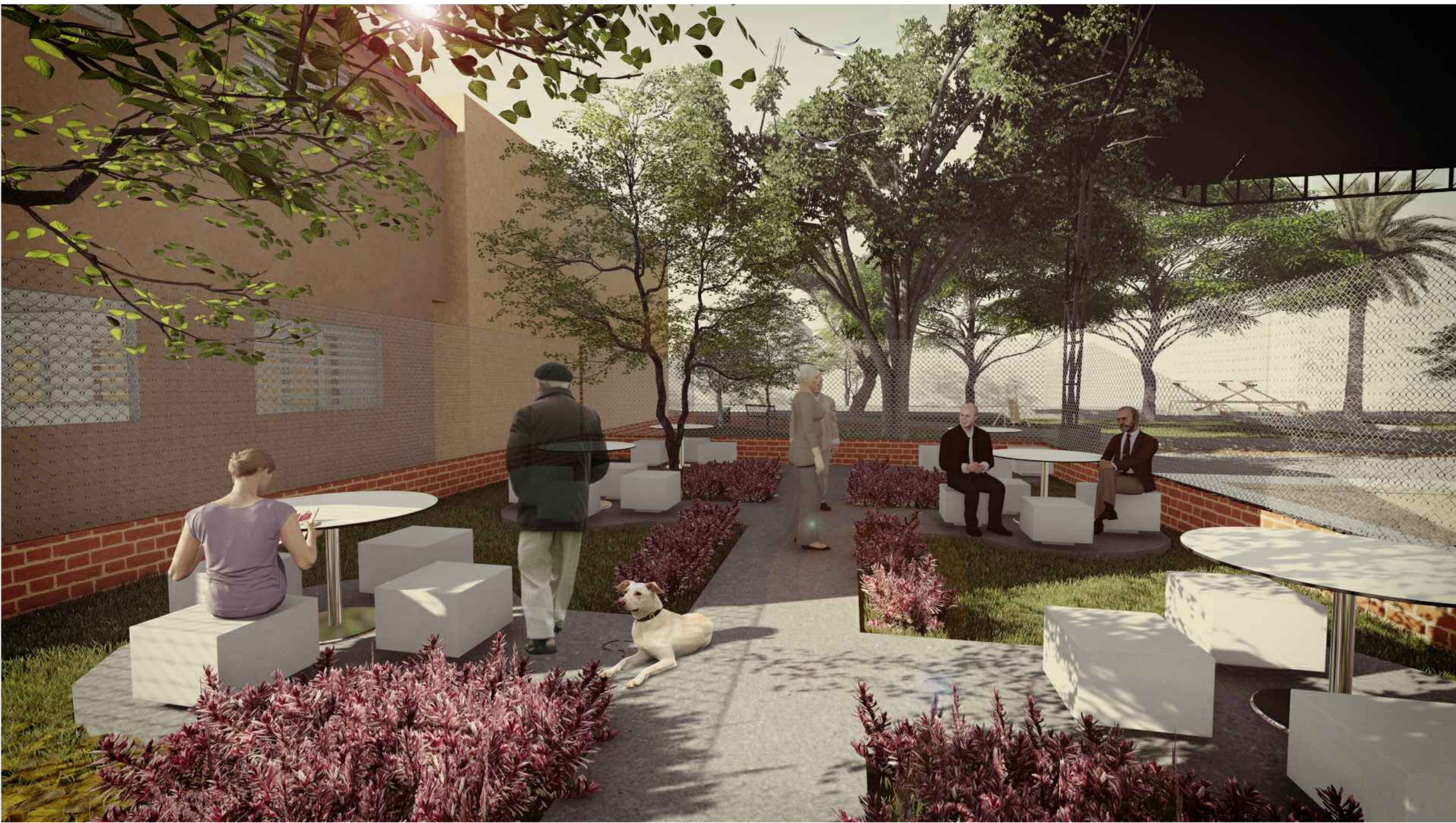
03 IMAGEN TERTULADERO