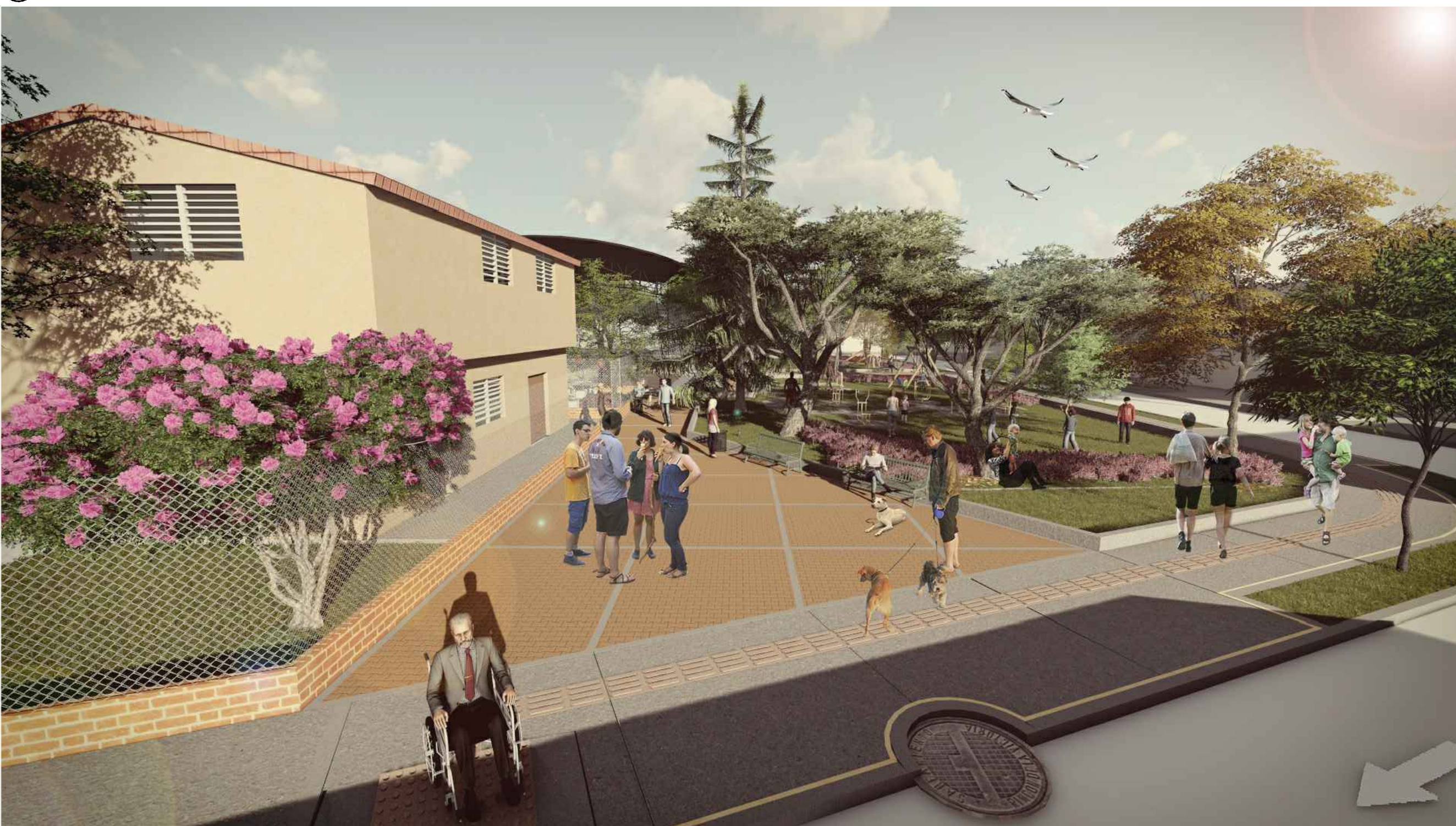
02 IMAGEN PLAZOLETA PRINCIPAL