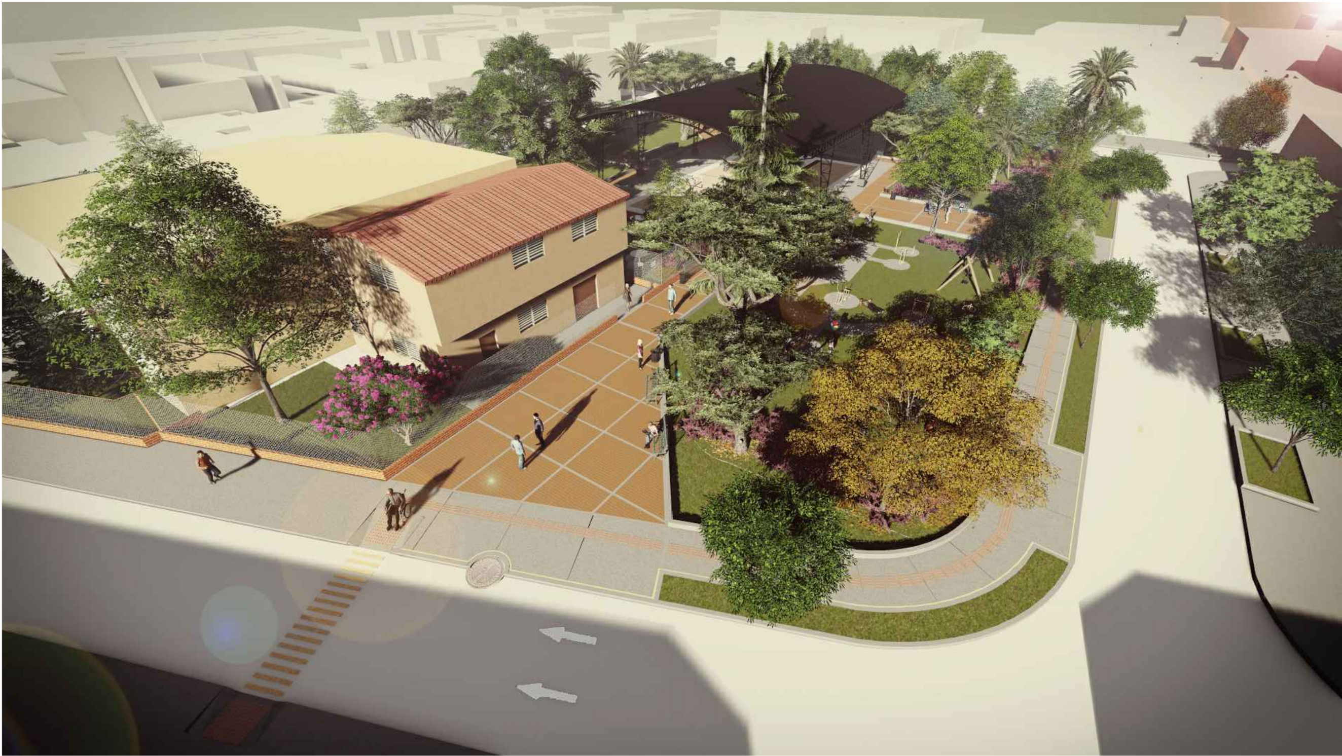
01 IMAGEN ÁREA