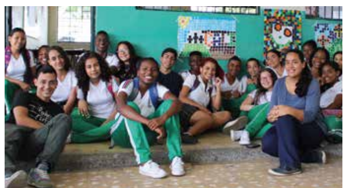
Primer encuentro con la metodología SARI (Secuencia de Actividad Recreativa Intensiva) del proyecto Fortalecimiento de las competencias básicas desde las Artes y la Cultura.