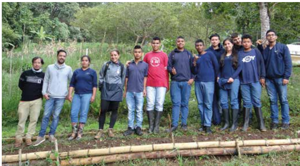
Los estudiantes de la IE La Paz en la zona rural de Cali aprenden a sembrar y cultivar alimentos con el objetivo de mejorar la soberanía alimentaria del corregimiento.