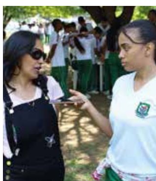
Los estudiantes de la IE Evaristo García construyen una estrategia de comunicación