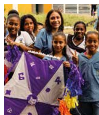
Cartas al viento: el cielo caleño se pintó de colores con cientos de cometas hechas a mano.