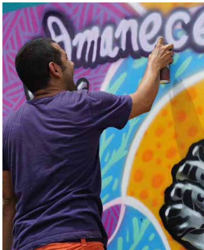
El barrio Potrero Grande, ubicado en la comuna 21 tendrá la Institución Educativa Oficial llamada Nuevo Amanecer.