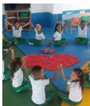
Los niños y niñas de preescolar manifiestan su amor jugando en la Ludoteca.