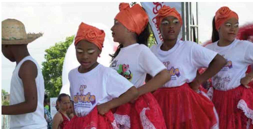
Integrantes del Tecnocentro Somos Pacífico comparten su talento con los habitantes de la comuna 21, mientras la comunidad le cambia el nombre a su nueva Institución Educativa Oficial del barrio Potrero Grande.