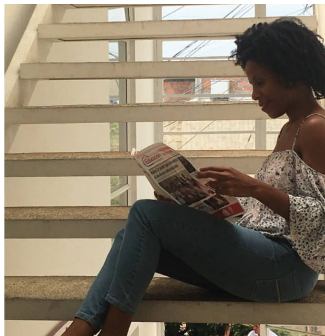
Asistentes a los Puntos Vide Digital leen nuestra primera edición del periódico.