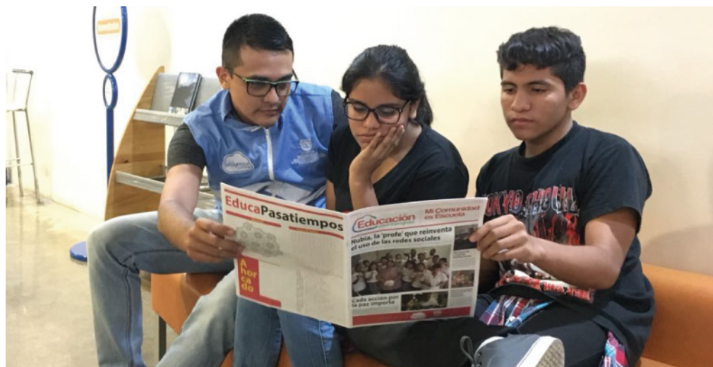
Asistentes a los Puntos Vide Digital leen nuestra primera edición del periódico.