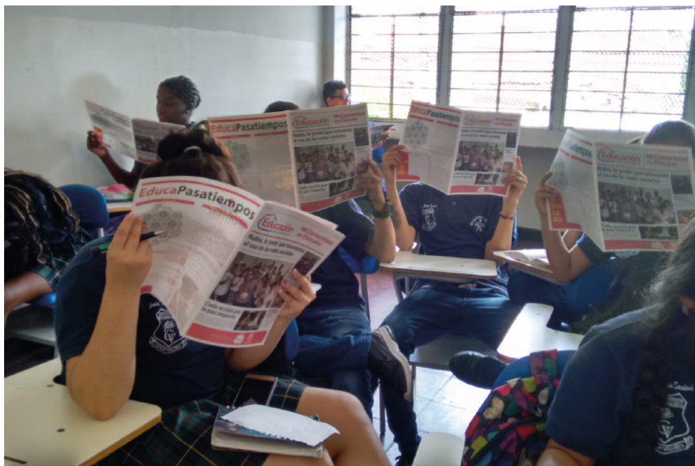
Los estudiantes de la IE Guillermo Valencia leen nuestra primera edición del periódico.