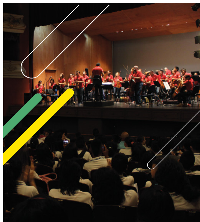
Concierto didáctico de la Filarmónica de Cali

Ellos realizaron un circuito cultural desde la Casa Proartes; seguido de un concierto didáctico en el Teatro Municipal a cargo de la Orquesta Filarmónica de Cali y de un espacio de promoción de lectura con la Red de Bibliotecas Públicas. Luego, se dividieron por grupos, algunos visitaron el área cultural del Banco de la República; otros hicieron un recorrido por el Cali Viejo en el Archivo Histórico de Cali y la Videoteca Municipal.