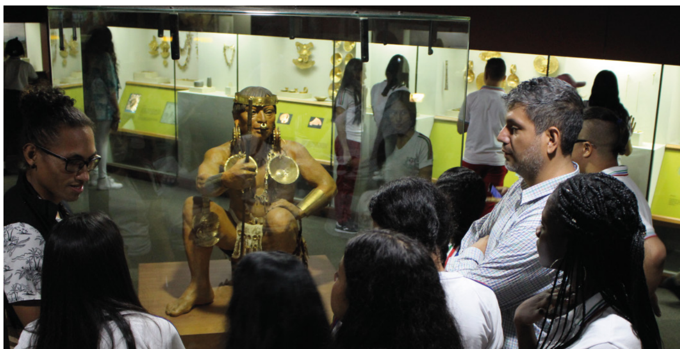
Visita de estudiantes al Museo de Oro Calima del Banco de la República