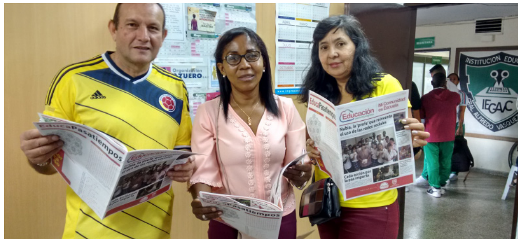
Directivos y docentes de la IE Alvasco leen nuestra primera edición del periódico.