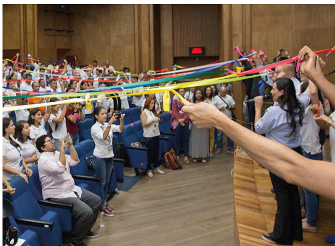
Con acto simbólico que simboliza la red del conocimiento se lanzó el Diplomado de Cultura Ciudadana para formadores deportivos de Mi Comunidad es Escuela.