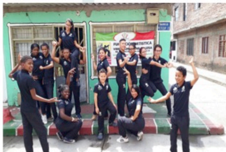
Bailarines de vieja guardia en 'El portón Caldense'

Ministerio de Cultura, Secretaría de Cultura del Valle y Secretaría de Cultura de Cali, se unen para impulsar proyecto que busca fortalecer a 60 escuelas en coreografía, vestuario y desarrollo cultural.