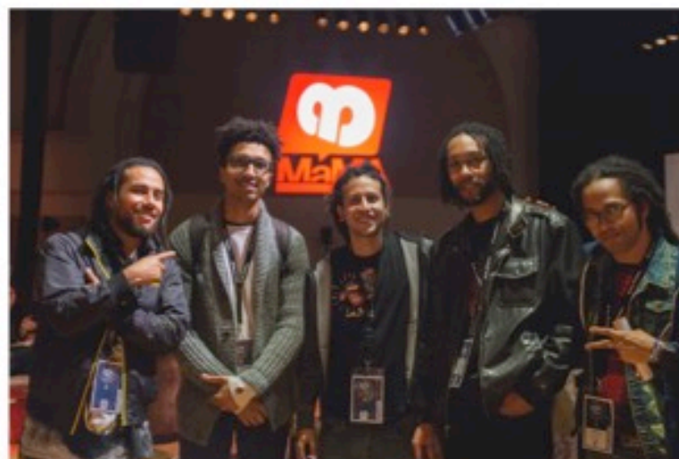
Artistas en el MaMa

30 creaciones artísticas circulan en escenarios nacionales e internacionales.