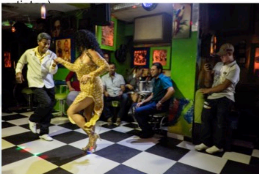
Bailarines de vieja guardia en El Habanero