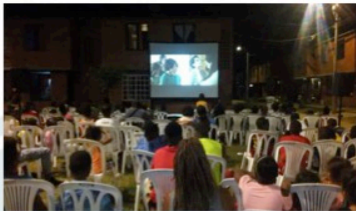
Festival Internacional de Cine 2017