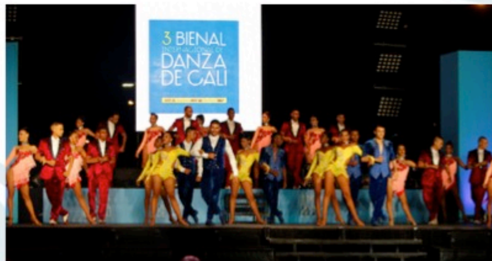
3 Bienal de Danza de Cali

XXIII Encuentro Mercedes Montañó 2017 Loma de la Cruz