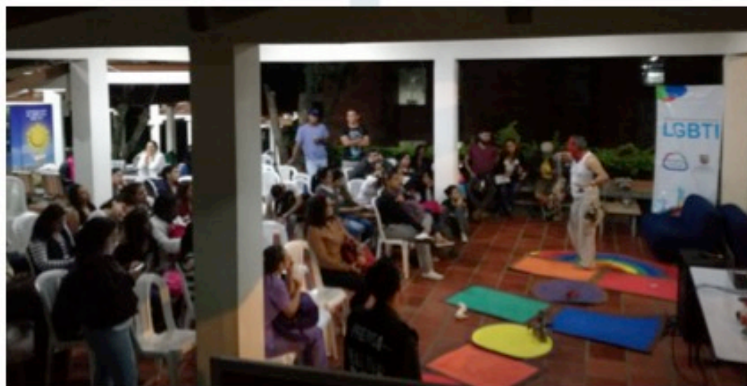
Presentación artística en la Universidad Católica

Campaña educativa para modificar imaginarios sociales sobre las personas que se identifican en el sector social LGTBI: