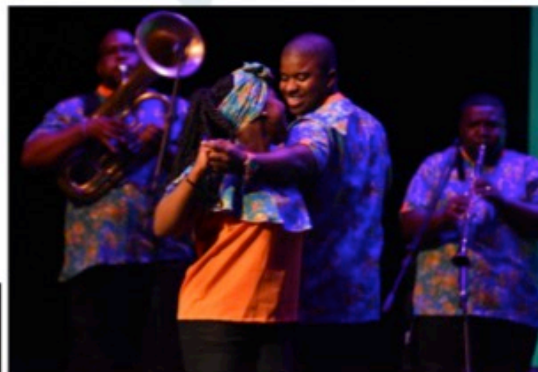
Lanzamiento del Festival 'Petronio' Álvarez en Bogotá.

407 artistas participan de las rutas de circulación creadas