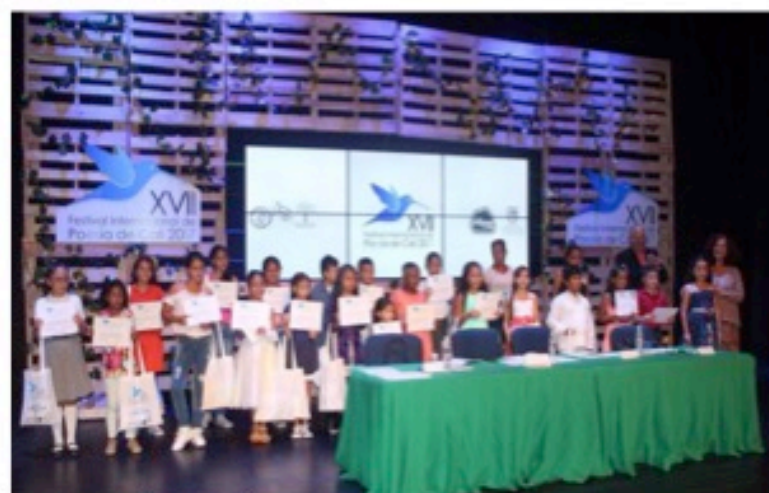
XVII Festival Internacional de Poesía