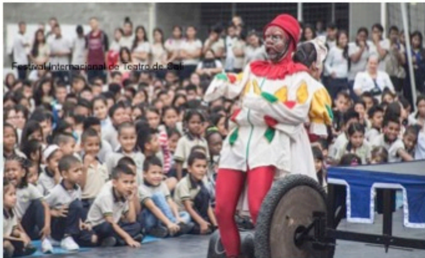
Festival Internacional de Teatro de Cali