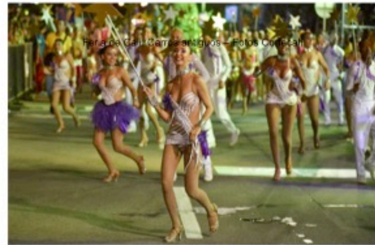
Feria de Cali Salsodromo